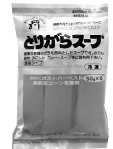
[5977] 冷凍とりからスープ 50g×5 605円 若鶏を3時間じっくり煮込んで作った濃縮冷凍スープです。天日塩があらかじめ調整してありますので、お好みに応じて薄めてスープやお料理にご利用下さい。