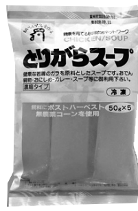
[5977] 冷凍とりがらスープ 50g×5 605円 若鶏を3時間じっくり煮込んで作った濃縮冷凍スープです。天日塩があらかじめ調合してありますので、お好みに応じて薄めてスープやお料理にご利用下さい。