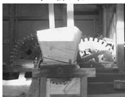
水車で2日ほど製粉

杉の葉は、樹齢50年以上のものを使用しています。杉もそれくらいの樹齢がないと粘りができません。