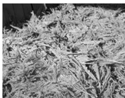
自然乾燥させた杉の葉を手で摘み取る

筑波山のふもと、周囲をぐるっと山に囲まれた茨城県八郷で作られている「水車杉線香」。原料は杉の葉と、筑波山麓の清流から汲んできた水だけです。混ざりものない杉のお線香から上る煙は情緒のある上品な香り。懐かしい様な杉の香りがおちつくと評判です。