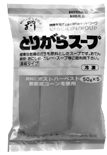
[5977] 冷凍とりがらスープ 50g×5 670円 若鶏を3時間じっくり煮込んで作った濃縮冷凍スープです。天日塩があらかじめ調合されていますので、お好みに応じて薄めてスープやお料理にご利用下さい。